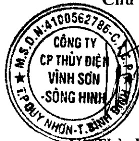
Võ Thành Trung